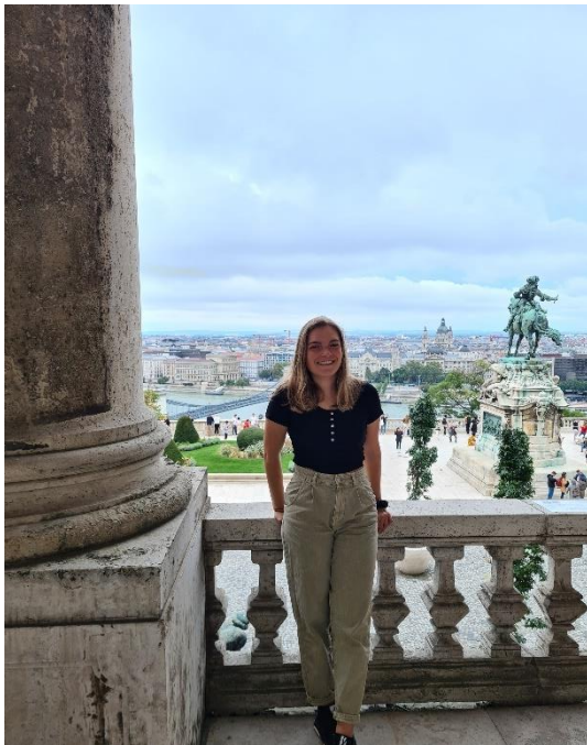
Aussicht vom Burgpalast auf das Eugen-von-Savoyen-Denkmal

Noch bevor ich überhaupt mein Studium aufnahm, stand für mich eines fest: Ich wollte die Welt sehen – und zwar nicht nur als Reisende, sondern mitten im Studium, mit all den Chancen, die damit verbunden sind. Für mich bedeutete das, über den fachlichen Tellerrand hinauszublicken, neue Kulturen kennenzulernen und gleichzeitig auch persönlich zu wachsen. Das ERASMUS-Programm bot dafür die perfekte Möglichkeit. An der MedUni Wien steht es im 5. Studienjahr offen, und für mich war schnell klar: Diese Chance wollte ich unbedingt nutzen.