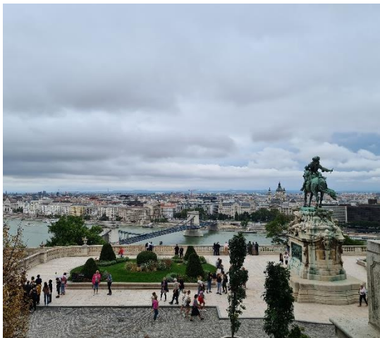
Aussicht vom Burgpalast auf das Eugen-von-Savoyen-Denkmal, die Kettenbrücke und den Stadtteil Pest